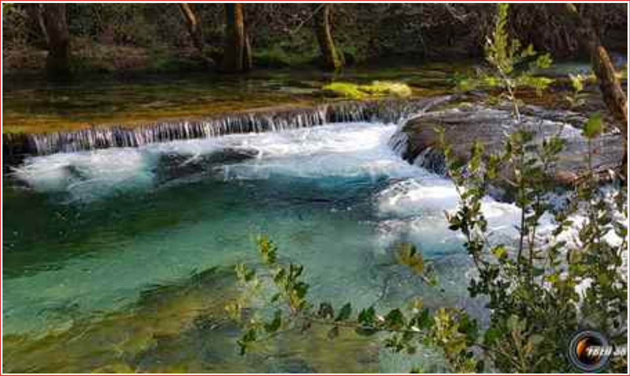
Le long de la Buèges.