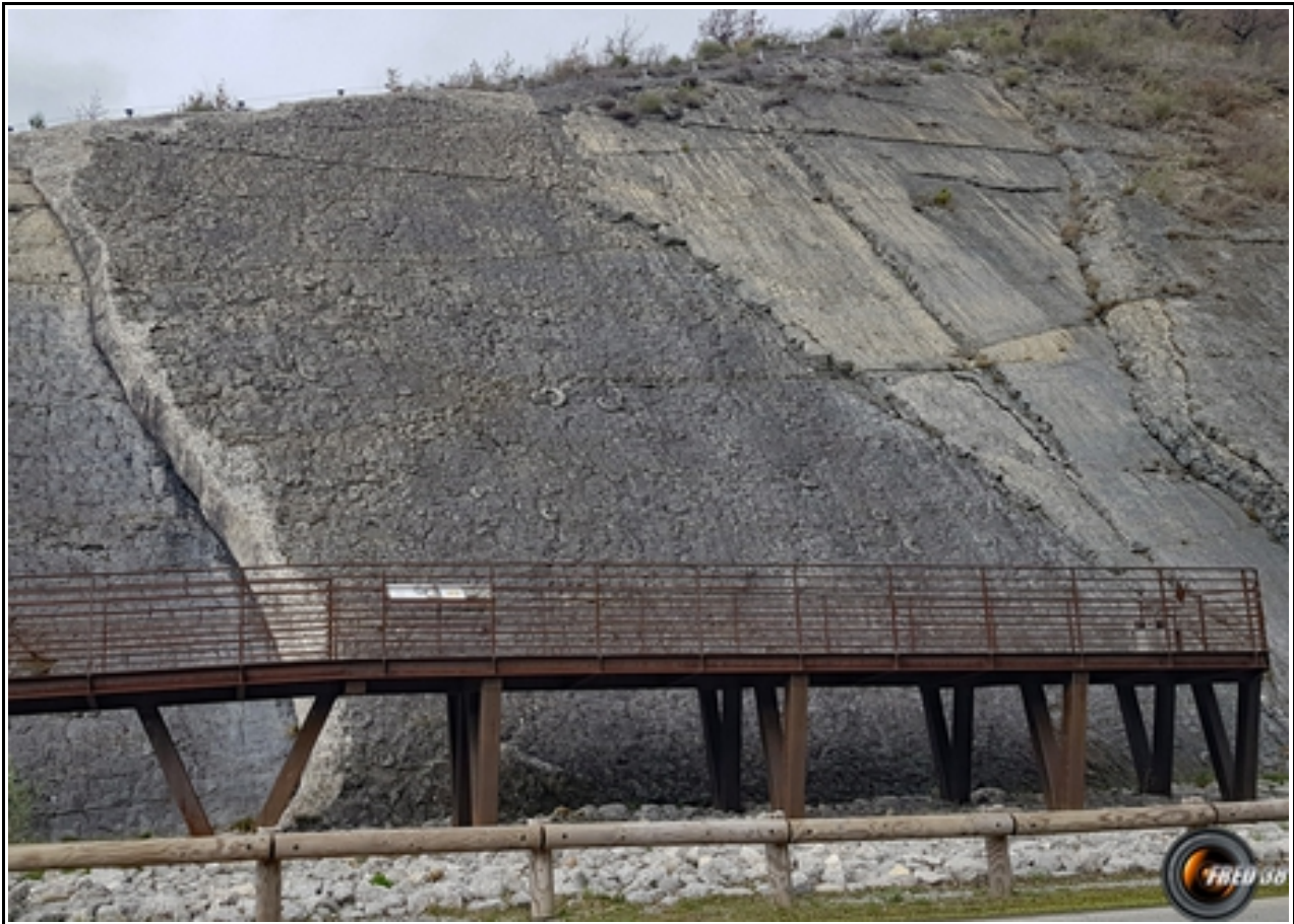
La grande dalle aux ammonites.