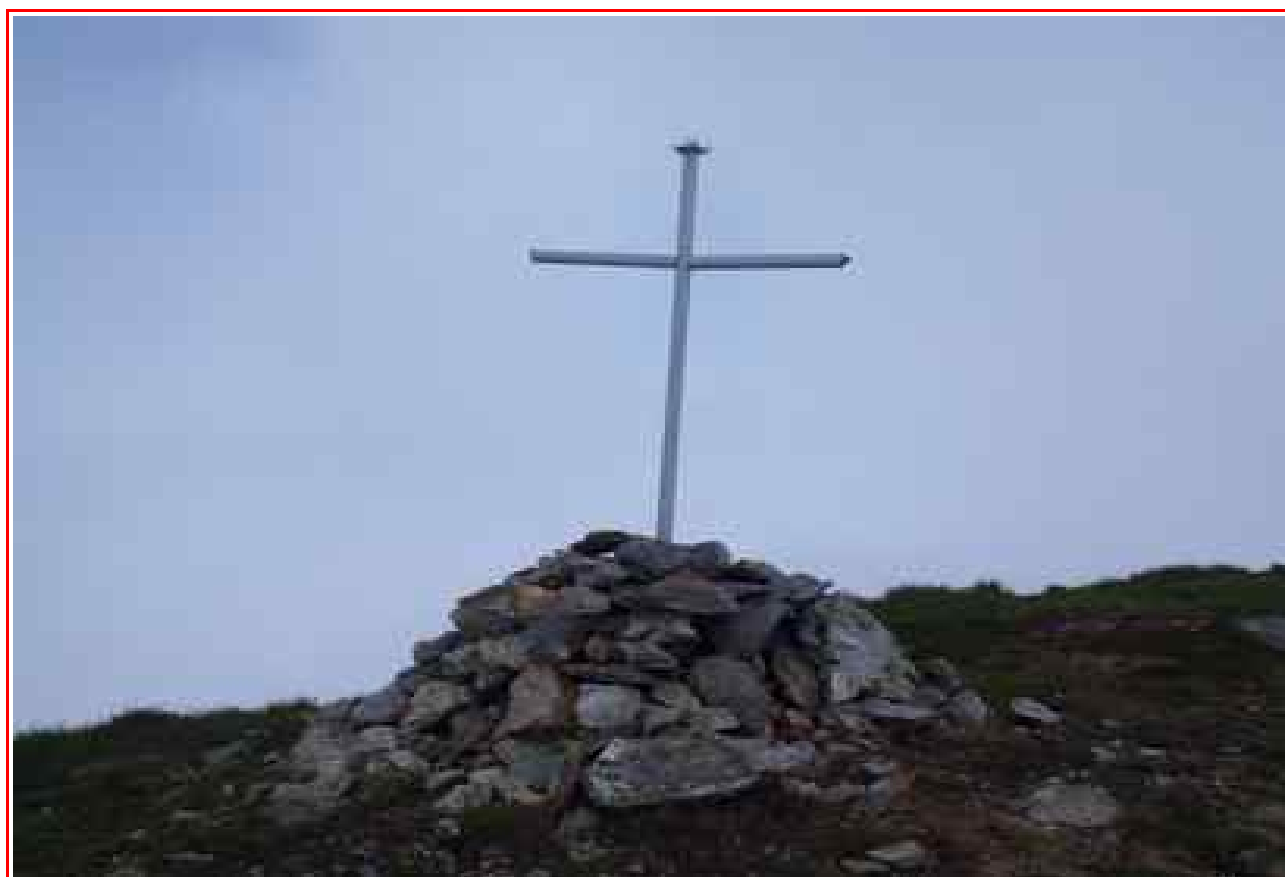
La croix du sommet