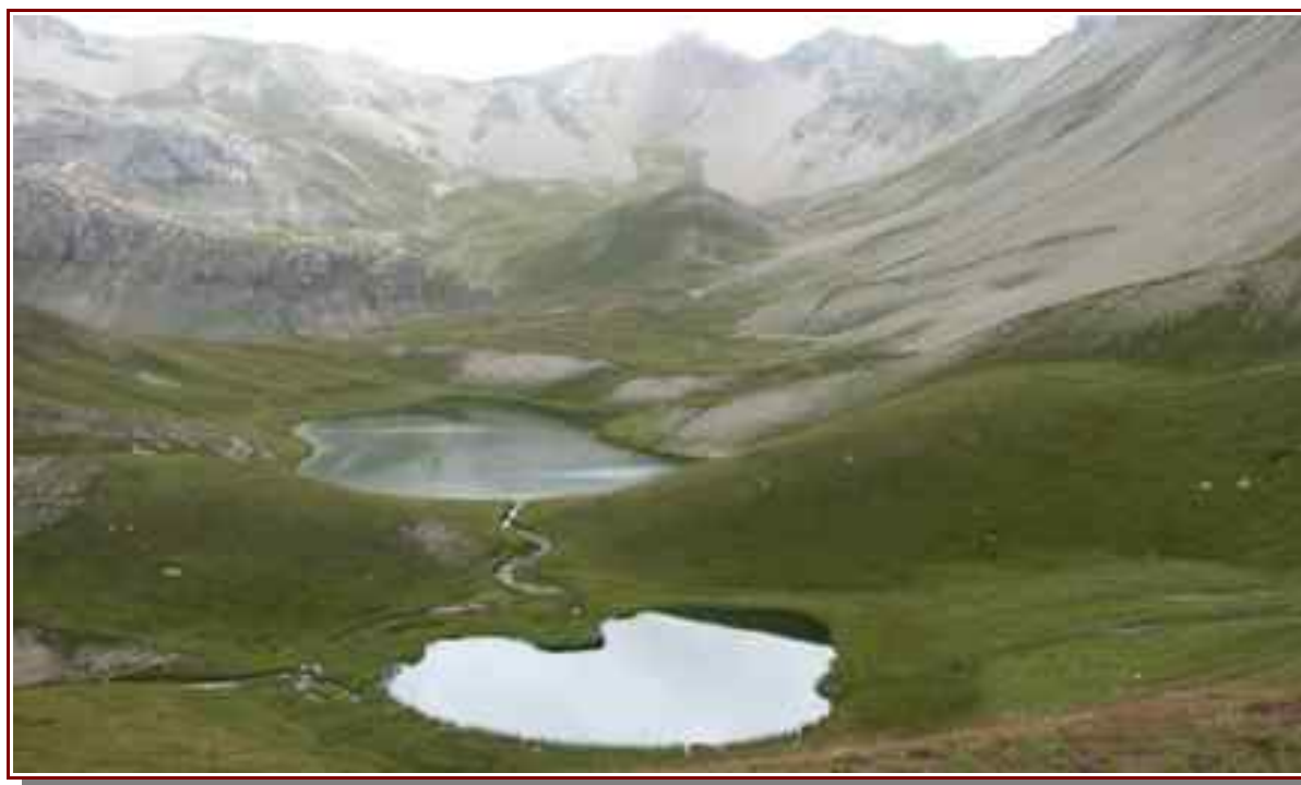
Les lacs d'Escur.

Itinéraire pour le sommet 12,8 km, 967 m de dénivelé positif.