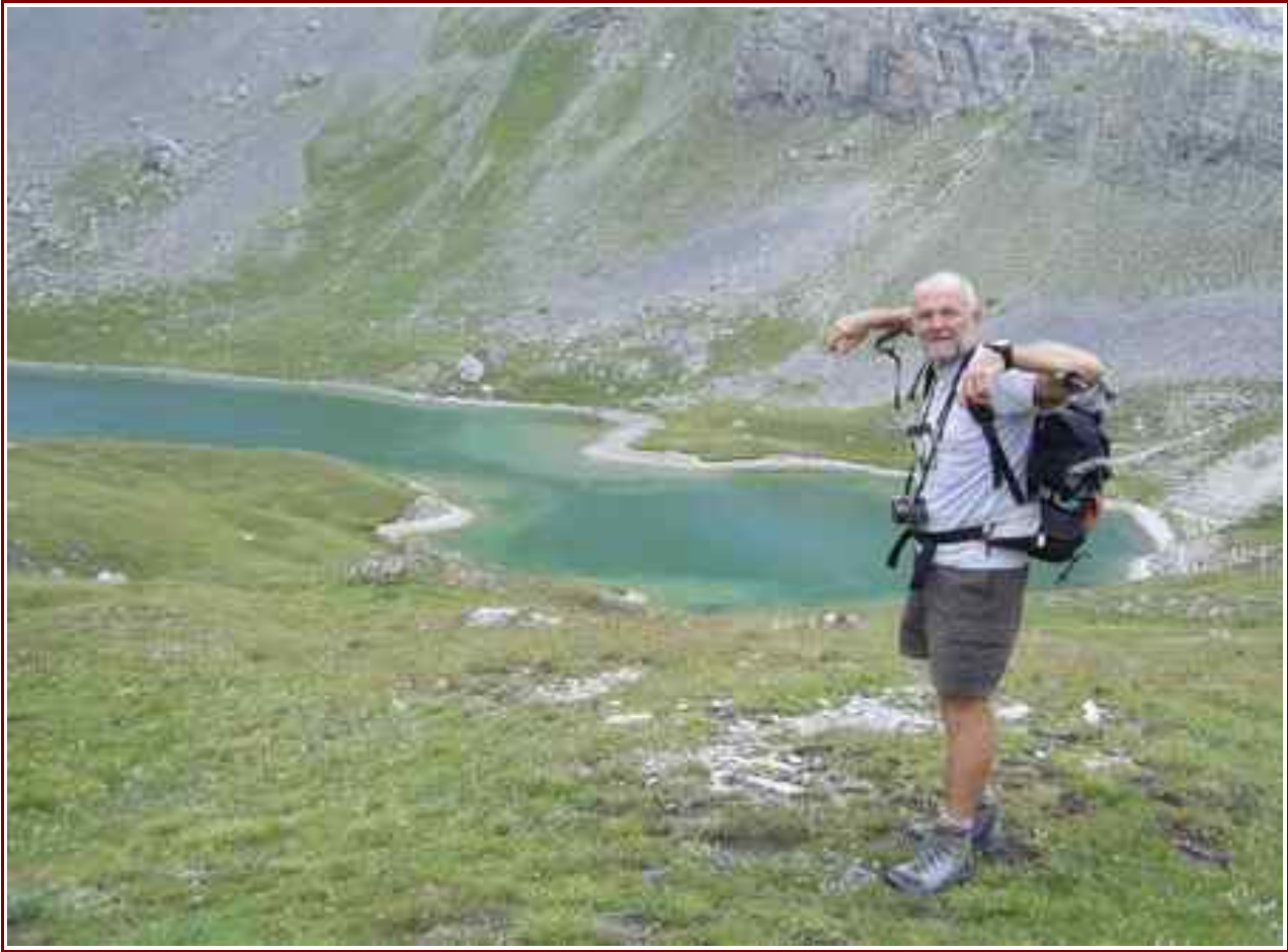
Le lac de l'Ascension