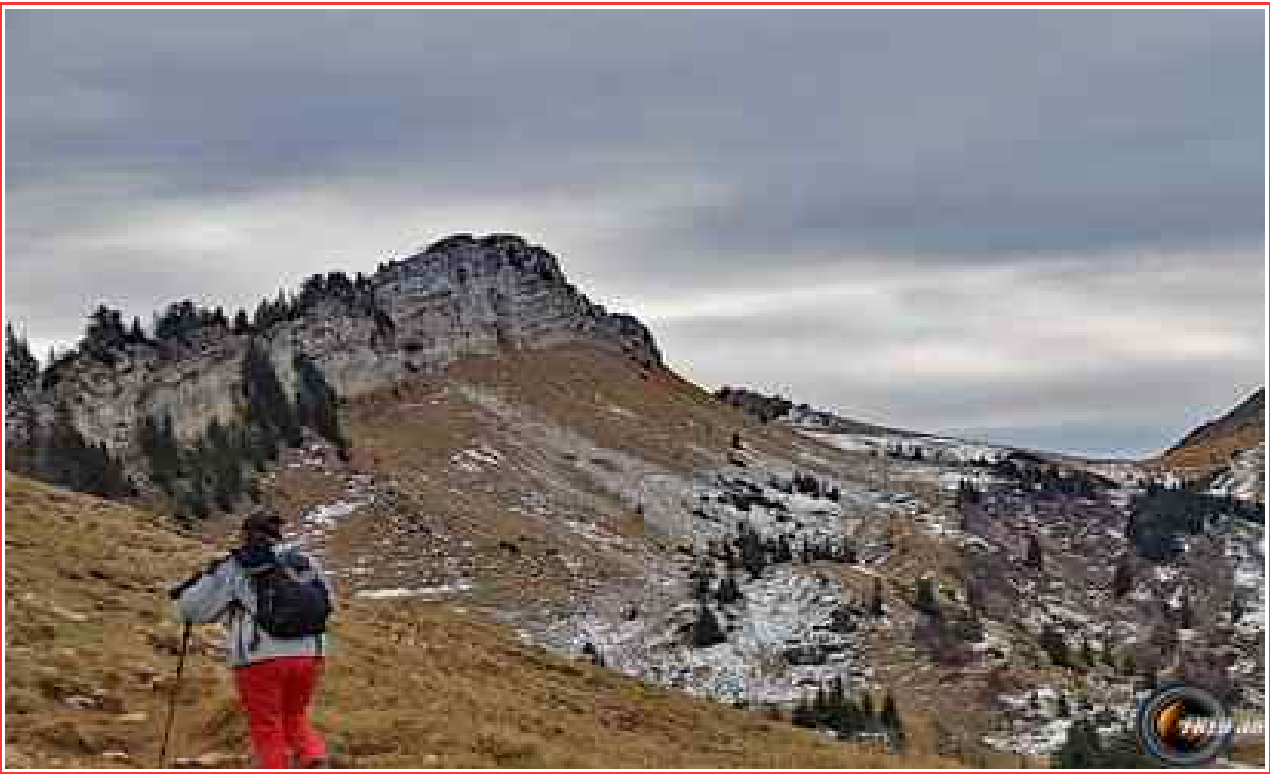
Le sommet vu du col des Charmilles.