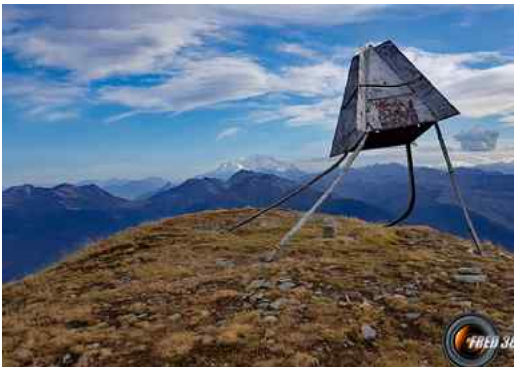
Le sommet et en fond le Mont-Blanc