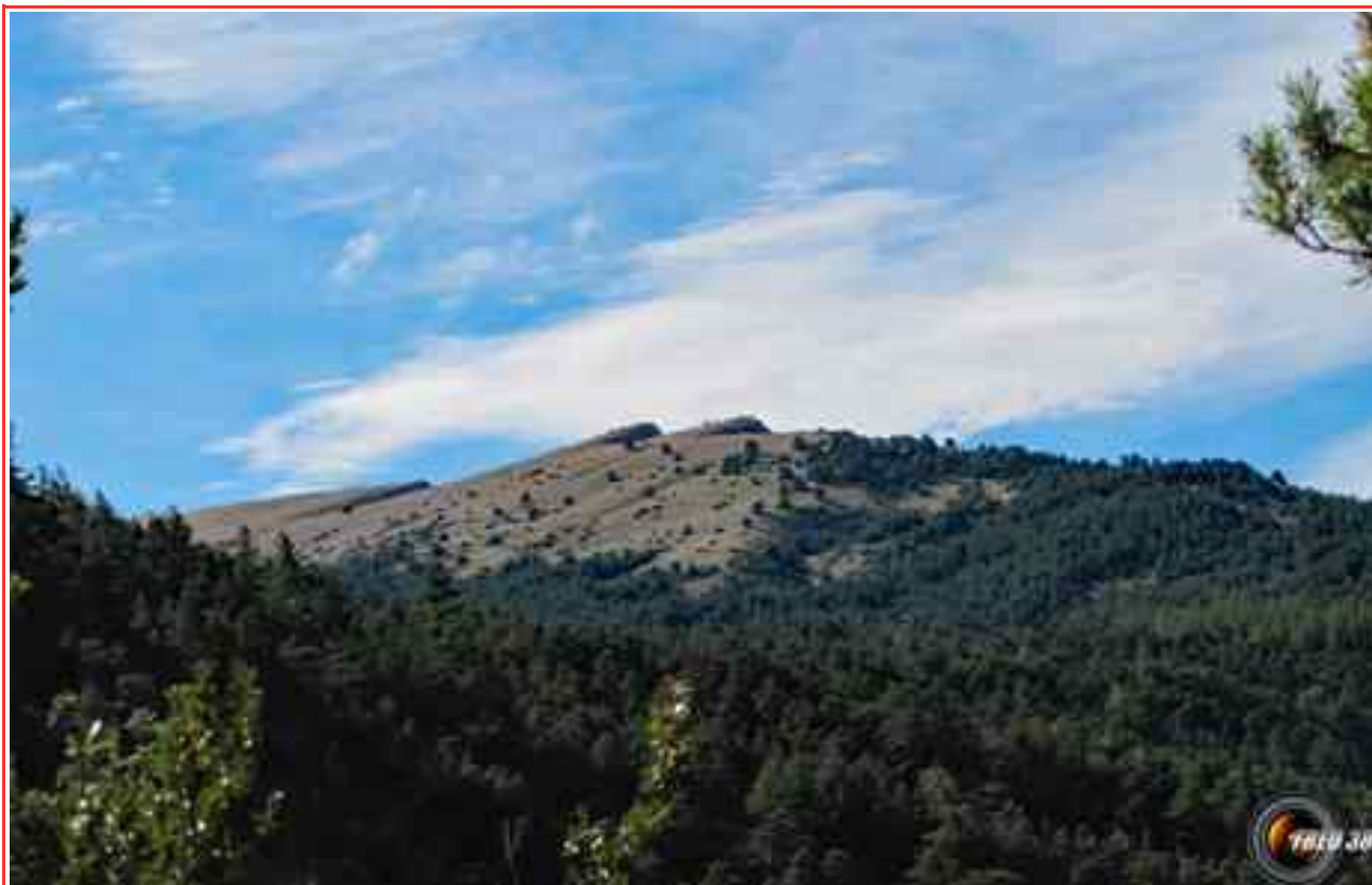
Le sommet vu du sentier.