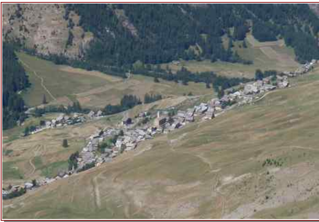
Le village de St Véran, vu du sommet.