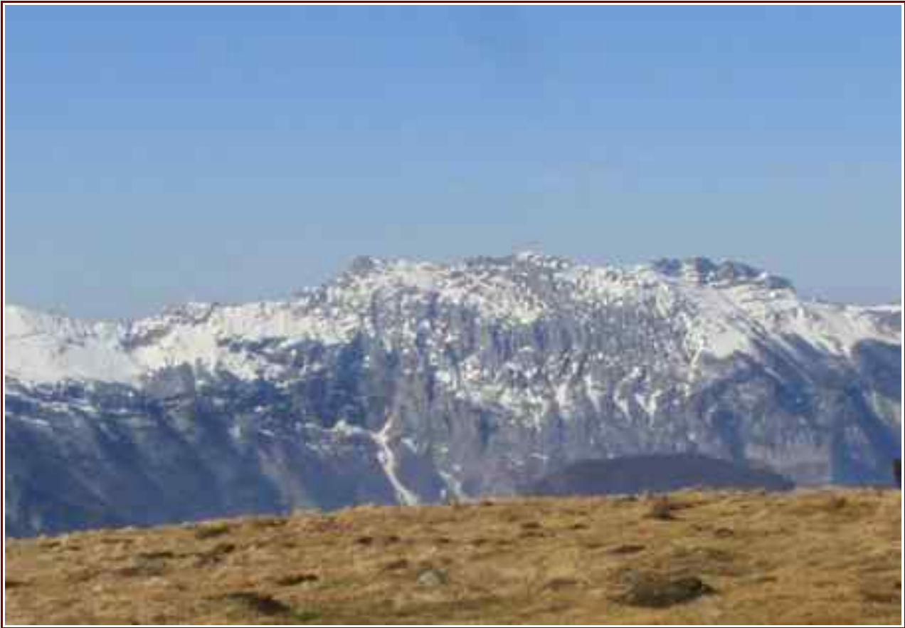
Le sommet vu du Senepy