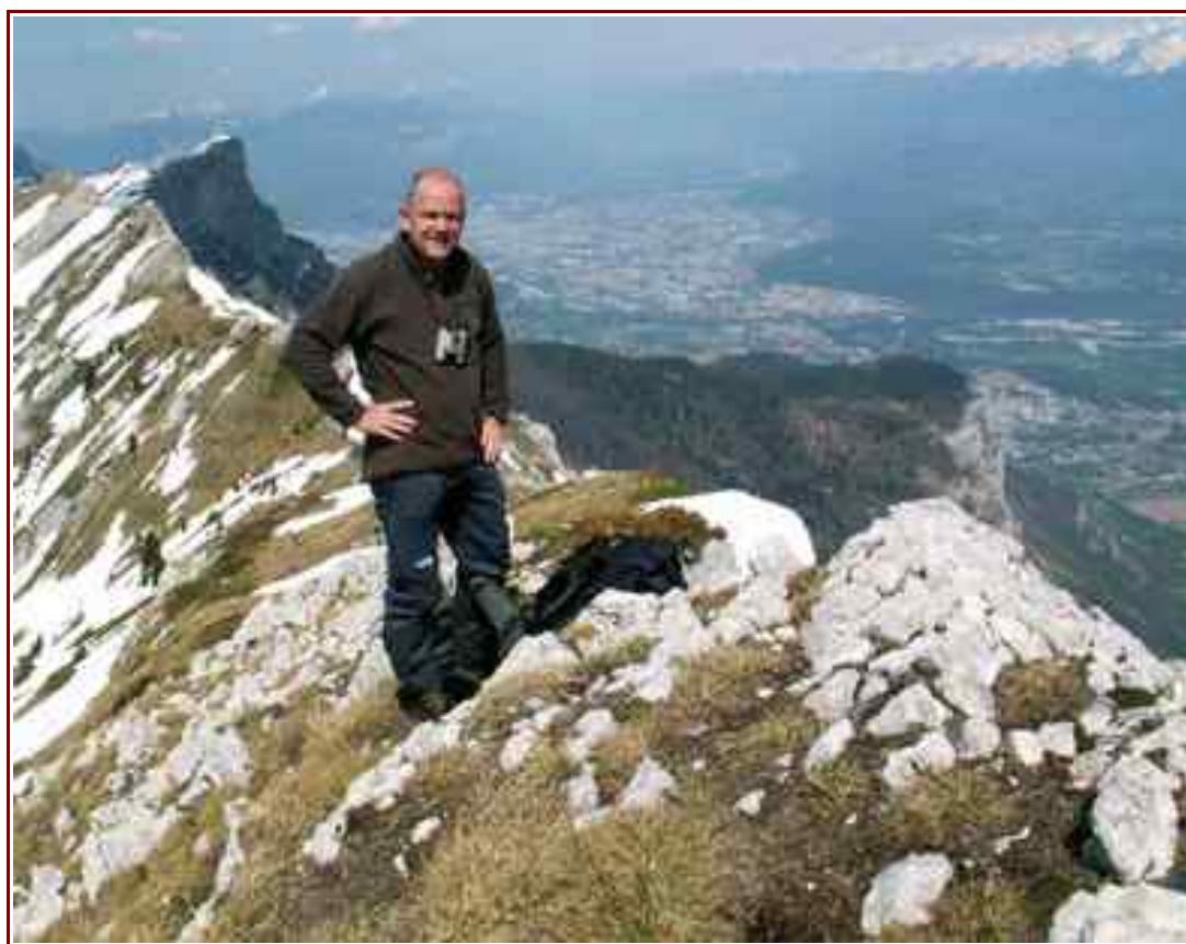
En fond Grenoble