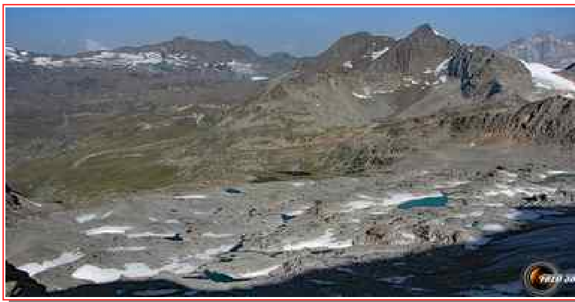
Lacs Blanc et noir