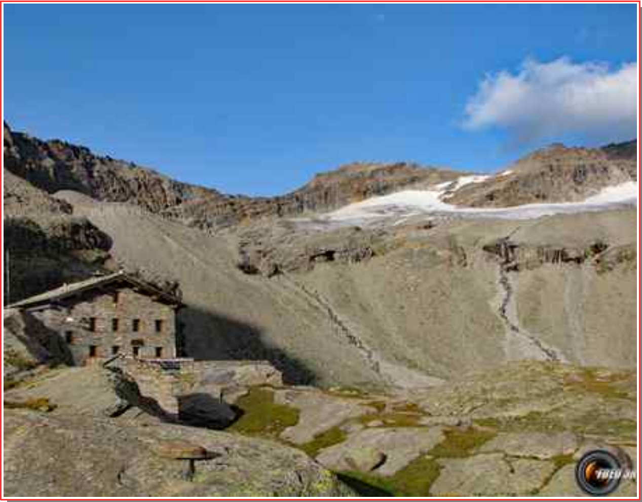
Le refuge du Carro.