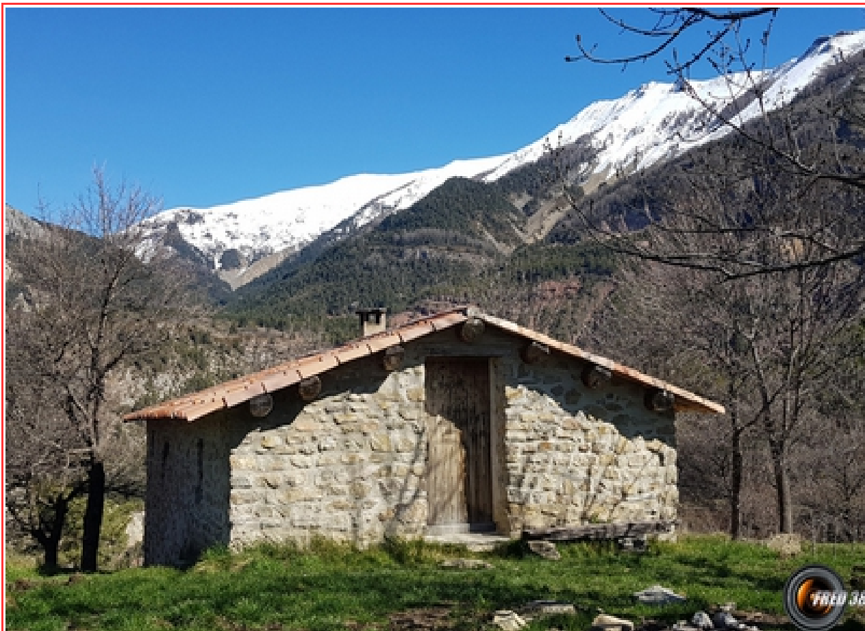
Le refuge d'art du Vieil Esclangon.